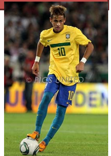
Talent Santos: Neymar

wedstrijd Puyol de pers te woord stond, was deze cup ook Tito Vilanova en Ibrahim Afellay. Bij Barca zal het familiegevoel altijd blijven. Leverkusen wordt de tegenstander in de 1/8 ste finale, en de verdedigers van Leverkusen liggen nu al te woelen in hun slaap hoe ze dit Barcelona nu moeten bestrijden. Tot nu toe is daar nog geen middel voor uitgevonden, dus laten we zolang het nog kan nog even genieten van het wegtikken van de tegenstander.