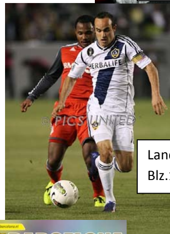
Landon Donovan Blz.14

De 12 de man is een nieuwe actie begonnen, want van April tot Juni kun je onze voetbalplaatjes sparen. 10 toppers zijn te krijgen, waaronder Iniesta, Henry, Nedved en anderen. Bij elk magazine krijg je 1 pakje met 4 kaartjes, en je kunt losse pakjes bijkopen voor 25 cent per pakje. Als je nog maar 1 of 2 plaatjes moet kun je die ook per stuk kopen voor 10 cent per stuk. Veel spaarplezier. Degene die als eerste zijn collectie compleet heeft, wint een trainingsset met pionnen, hesjes en een fluitje!